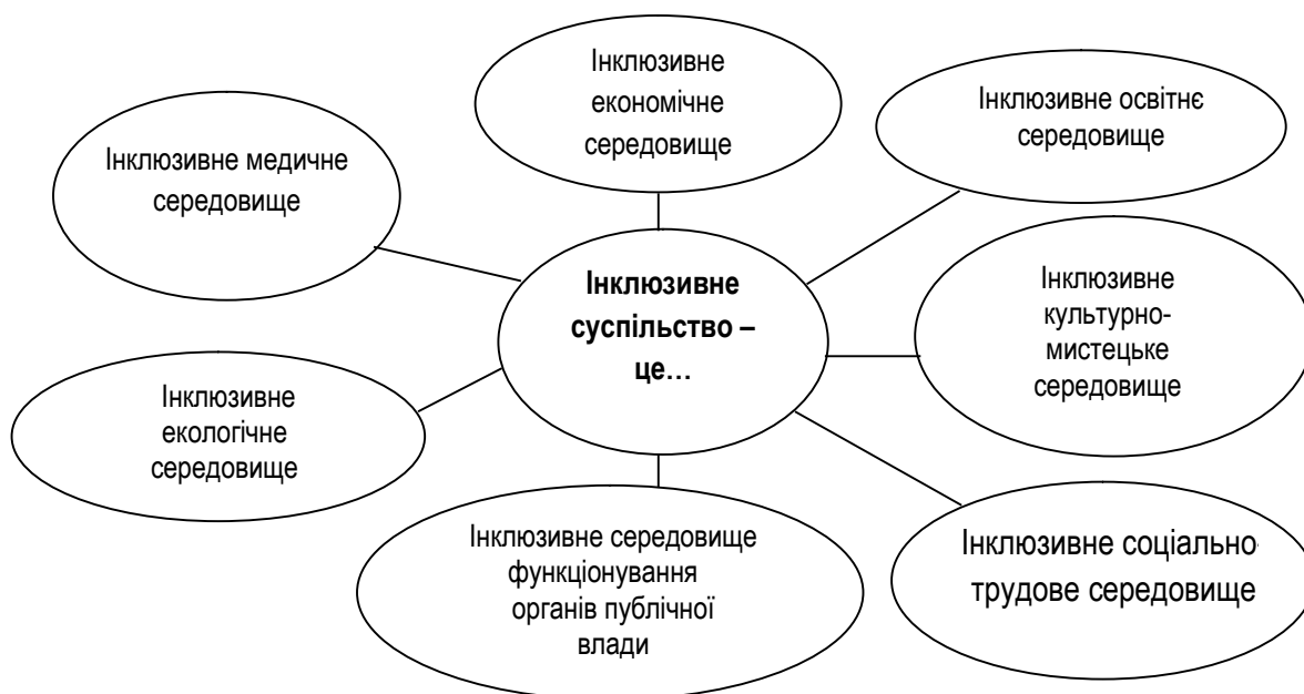
Рис. 2. Складові сформованого інклюзивного суспільства (за матеріалами [7; 11; 16-18]).

На сучасному етапі розвитку України процес побудови безбар'єрного (інклюзивного) простору ще триває і потребує сформованості інклюзивного суспільства, відкритого до змін, в якому створені умови для розвитку інклюзивних органів публічної влади, інклюзивного економічного, освітнього, культурно-мистецького, соціально-трудового, екологічного (довкілцевого), медичного середовища (рис. 2).