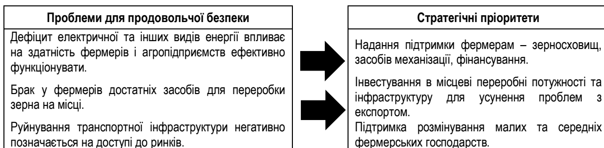
Рис.1. Стратегічні пріоритети України у подоланні продовольчої безпеки у 2023–2024 рр.

Для запобігання продовольчої безпеки в Україні у 2022 р. ООН і Уряд розробили Стратегію щодо підтримки зберігання зерна, спрямовану на модернізацію та оптимізацію складських потужностей малих і середніх фермерських господарств із метою збереження якомога більшої частини врожаю 2021–2022 рр. і запобігання катастрофі у сфері продовольчої безпеки не лише в Україні, а й в усьому світі, враховуючи глобальну залежність від експорту продовольства з України (рис. 1). Згідно з цією стратегією ООН надала фермерам альтернативні зерносховища та засоби механізації. Майже 1900 фермерів подали заявки на отримання тимчасових зерносховищ і засобів механізації для навантаження і розвантаження зерна зі сховищ. Фермерам було видано 25 тис. рукавів для зберігання зернових, загальна місткість яких становить 5,2 млн. метричних тон [9].